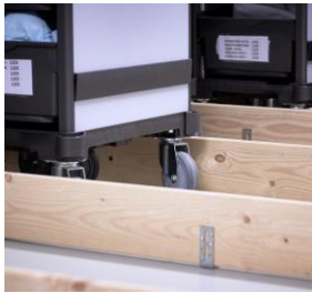
Særligt indrettede båse sikrer, at vognene altid står i orden – klar til brug.

Men først skal de fylde den op, så den er klar til næste dag. Det burde være nemt. For lageret, der findes i samme rum som vognens parkeringsplads, er optimeret. Ting, der ikke blev brugt, er smidt ud. Det er gjort overskueligt, og det er sammenhængende. Alt er afmærket, og hver ting har sin egen plads med tydelige afgrænsninger. Og det er let at holde orden.