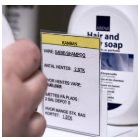
Kortsystemet sikrer, at plejepersonalet aldrig løber tør for varer.

Depotet er lille – ca. 35 m 2 – det er imponerende lille for et plejecenter med 95 beboere. Især når det ikke længere er nødvendigt med depoter på gangene og i boligerne. Et smart kortsystem sikrer, at der altid er tilstrækkeligt med varer.