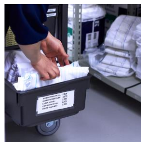
Det er let - og hurtigt - at genopfylde, når alle varer er lige til at snuppe.

Når vagten er slut, tager plejepersonalet LEAN-artikelvognen med retur til 'parkeringspladsen' på vej til omklædningen. På vej ud af elevatoren møder personalet 'supermarkedet' af varer i kælderen. En lille gåtur på fire skridt med vognen forbi hylderne, og LEAN-artikelvognen er genopfyldt og klar til næste kollega, der møder ind.