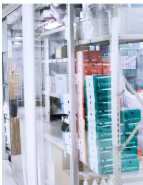
Alle artikler i 'supermarkedet' står i rækkefølge efter først-ind først-ud princippet, så medarbejderne hurtigt og enkelt kan fylde LEAN-artikelvognen op igen.

Men først skal de fylde den op, så den er klar til næste dag. Det burde være nemt. For lageret, der findes i samme rum som vognens parkeringsplads, er optimeret. Ting, der ikke blev brugt, er smidt ud. Det er gjort overskueligt, og det er sammenhængende. Alt er afmærket, og hver ting har sin egen plads med tydelige afgrænsninger. Og det er let at holde orden.